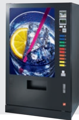
FK 320 FT: flache Tür, beleuchteter Türausschnitt