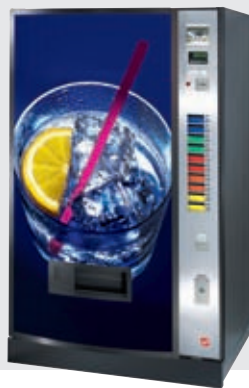
FK 270 EC: gewölbte, hinterleuchtete Türfront