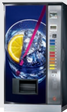
FK 280 EO: LGA geprüfte Outdoor-Version (IP 24)