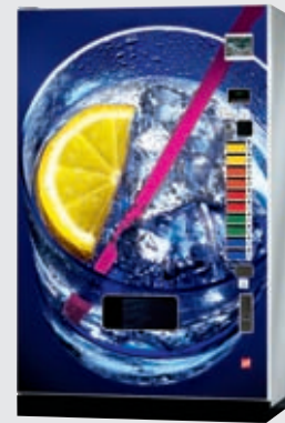
FK 230 CV: flache Tür, unbeleuchtet