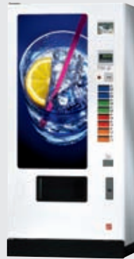
FK 185 FT: flache Tür, beleuchteter Türausschnitt